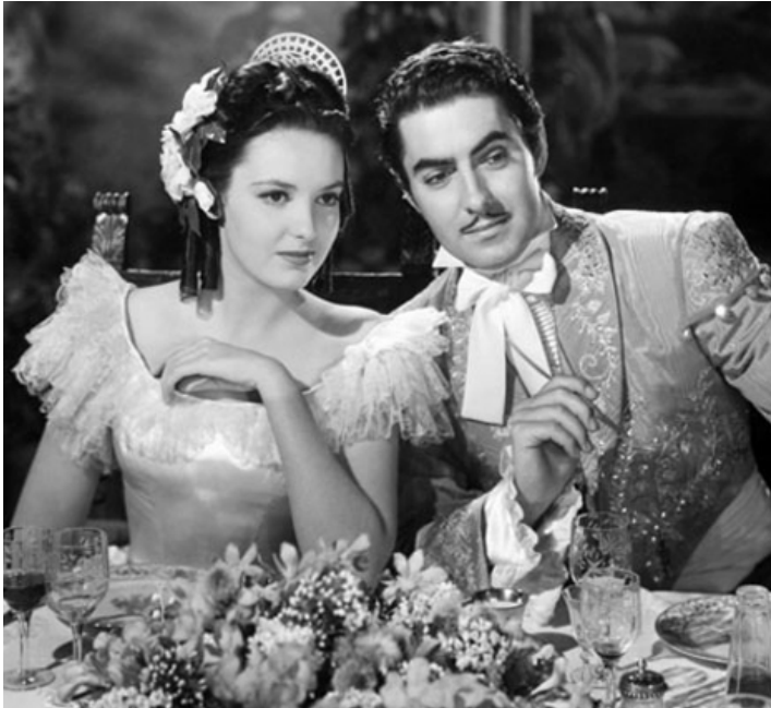
1941 ARÈNES SANGLANTES (Blood and Sand) de Rouben Mamoulian avec Tyrone Power