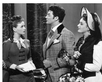
1946 QUADRILLE D'AMOUR (Centennial Summer) d'Otto Preminger avec Jeanne Crain, C. Wilde