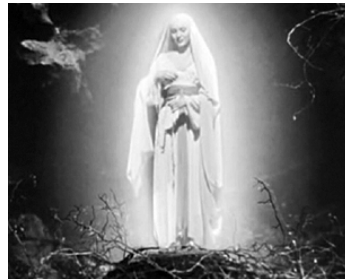
1943 LE CHANT DE BERNADETTE (The Song of Bernadette) d'Henry King