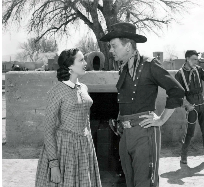
1950 LES REBELLES DE FORT THORN (Two Flags West) de Robert Wise avec Joseph Cotten