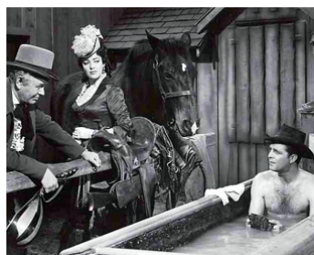
1956 GUET-APENS CHEZ LES SIOUX (Dakota Incident) de L. Foster avec Regis Toomey, Dale Robertson