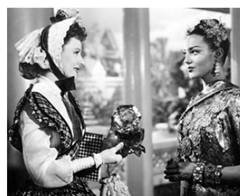
1946 ANNA ET LE ROI DE SIAM (Anna and the King of Siam) de John Cromwell avec Irene Dunne