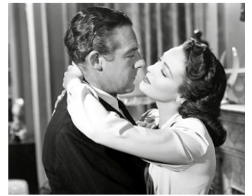
1948 CHAÎNES CONJUGALES (A Letter to three Women) de J. Mankiewicz avec Paul Douglas