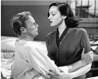
1949 LA PORTE S'OUVRE (No Way out) de Joseph L. Mankiewicz avec Richard Widmark