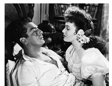
1946 LA POURSUITE INFERNALE (My Darling Clementine) de John Ford avec Victor Mature