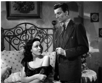
1950 LA TREIZIÈME LETTRE (The thirteenth Letter) d'Otto Preminger avec Michael Rennie