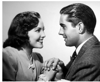
1939 MA SECRÉTAIRE EST UNE PERLE (Day-Time Wife) de Gregory Ratoff avec Tyrone Power