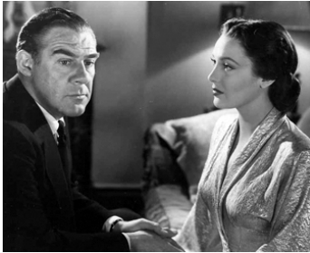
1949 SI MA MOITIÉ SAVAIT ÇA (Everybody does it) d'Edmund Goulding avec Paul Douglas