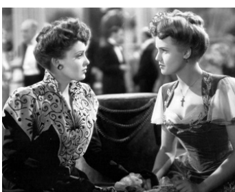
1945 LE GRAND JOHN (The Great John L.) de Frank Tuttle avec Barbara Britton