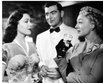
1951 EVE PAIE SA DETTE (The Lady pays off) de D. Sirk avec Stephen McNally, Virginia Field