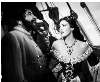
1952 BARBE-NOIRE LE PIRATE (Blackbeard the Pirate) de Raoul Walsh avec Robert Newton