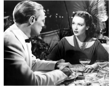
1949 LA FURIE DES TROPIQUES (Slattery's Hurricane) d'A. De Toth avec Richard Widmark