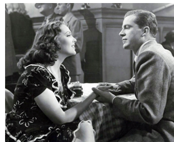
1945 CRIME PASSIONNEL (Fallen Angel) d'Otto Preminger avec Dana Andrews