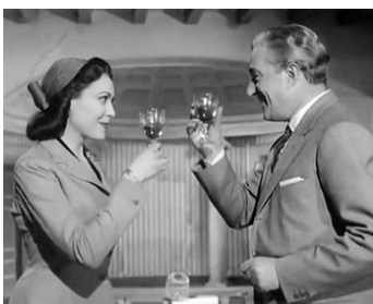
1955 LES CINQ DERNIÈRES MINUTES (Gli ultimi cinque minuti) de G. Amato avec Vittorio De Sica