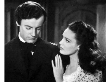
1942 THE LOVES OF EDGAR ALLAN POE d'Harry Lachman avec Shepperd Strudwick