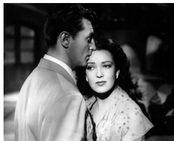
1953 PASSIONS SOUS LES TROPIQUES (Second Chance) de Rudolph Maté avec Robert Mitchum