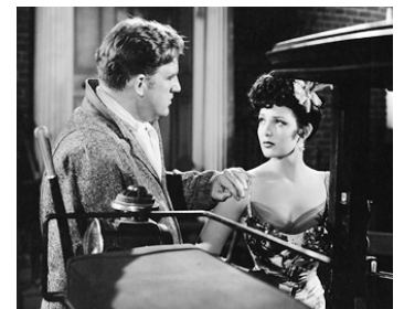
1945 HANGOVER SQUARE (Hangover Square) de John Brahm avec Laird Cregar