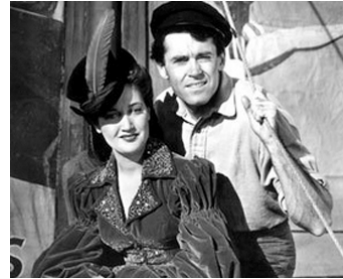
1940 LA BELLE ÉCUYÈRE (Chad Hanna) d'Henry King avec Henry Fonda