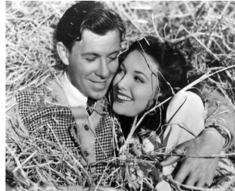
1941 RISE AND SHINE d'Allan Dwan avec George Murphy