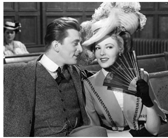
1948 LA VILLE EMPOISONNÉE (The Walls of Jericho) de John M. Stahl avec Kirk Douglas