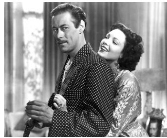
1948 INFIDÈLEMENT VÔTRE (Unfaithfully yours) de Preston Sturges avec Rex Harrison