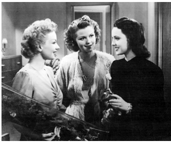
1939 HÔTEL POUR FEMMES (Hotel for Women) de G. Ratoff avec Ann Sothorn, Jean Rogers