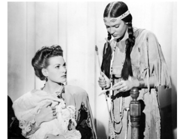
1944 BUFFALO BILL (Buffalo Bill) de William A. Wellman avec Maureen O'Hara