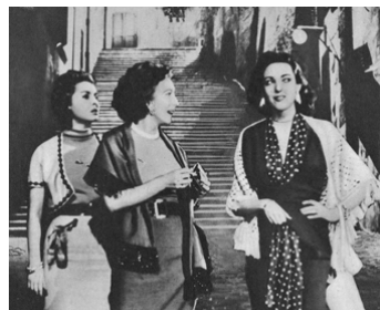
1953 FEMMES DAMNÉES (Donne proibite) de G. Amato avec V. Cortese, Lea Padovani