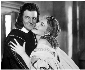
1947 AMBRE (Forever Amber) d'Otto Preminger avec Cornel Wilde