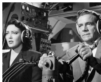
1957 À L'HEURE ZÉRO (Zero Hour) d'Hal Bartlett avec Dana Andrews