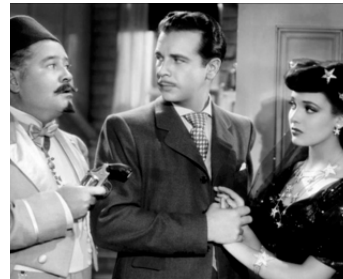
1943 C'EST ARRIVÉ DEMAIN (It happened tomorrow) de René Clair avec Jack Oakie, Dick Powell