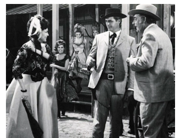
1964 LES ÉPERONS NOIRS (Black Spurs) de R. G. Springsteen avec Rory Calhoun, Lon Chaney Jr