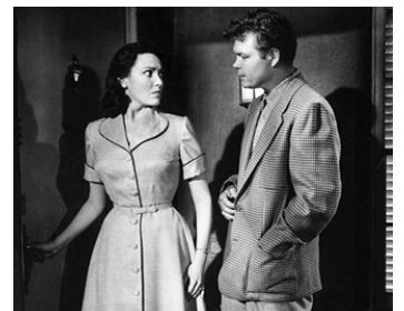
1954 THIS IS MY LOVE de Stuart Heisler avec Hal Baylor