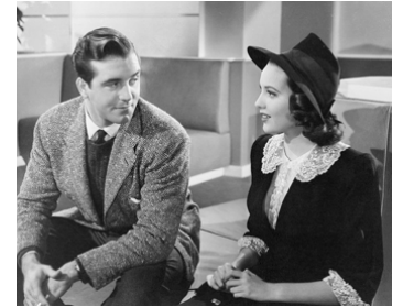
1940 LA RANÇON DE LA GLOIRE (Star Dust) de Walter Lang avec John Payne