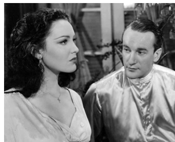
1944 L'AVEU (Summer Storm) de Douglas Sirk avec George Sanders