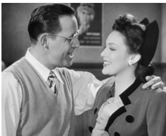
1944 SWEET AND LOW-DOWN d'Archie Mayo avec Benny Goodman