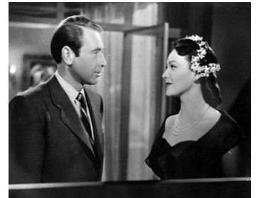
1952 MORTON A-T-IL TUÉ ? (Night without sleep) de Roy Ward Baker avec Gary Merrill