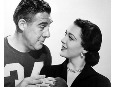
1950 THE GUY WHO CAME BACK de Joseph M. Newman avec Paul Douglas