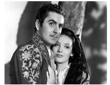
1940 LE SIGNE DE ZORRO (The Mark of Zorro) de Rouben Mamoulian avec Tyrone Power